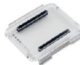
Ochranný zadní kryt