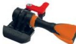
Držák se dvěma šrouby