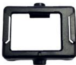
Rámeček na kameru