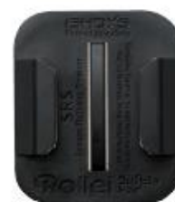
Safety Pad rovný s 3M nálepkou