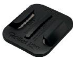
Safety Pad zahnutý s 3M nálepkou